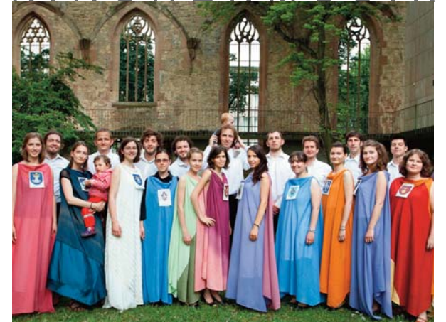
Der Jugendbachchor nach dem Konzert in der Stuttgarter Hospitalskirche am 14. Juni 2011.