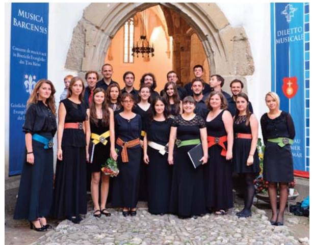
Dieses Jahr feiert der Jugendbachchor Kronstadt den 20. Geburtstag. Wir gratulieren.