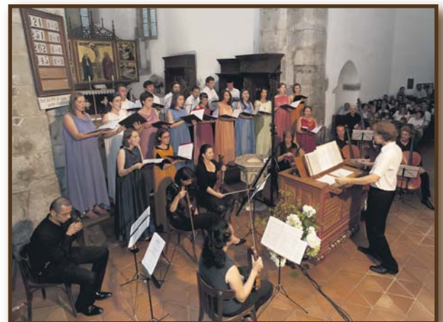
Jugendbachchor Kronstadt beim Festival „Diletto musicale“, Tartlau, 2010