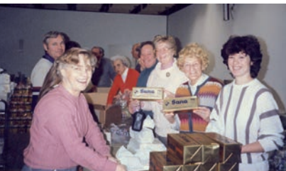
30 Jahre Sozialwerk. Paketaktion der Kreisgruppe Düsseldorf 1983.

Rückblick laden auch weitere Jubiläen ein. Vor 30 Jahren wurden das Sozialwerk der Siebenbürger Sachsen, die Siebenbürgisch-Sächsische Jugend in Deutschland