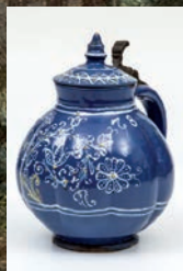
HABANER DECKELKRUG, Winzendorf (Alvinc), dat. „1678“

Trappenseeschlösschen · 74074 Heilbronn Tel. ++49 71 31 - 155570 info@auctions-fischer.de · www.auctions-fischer.de