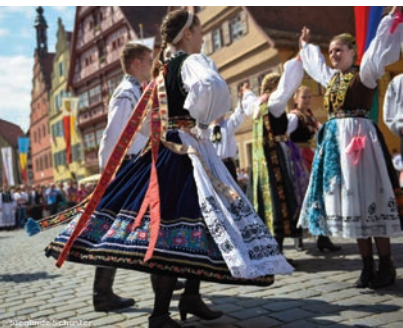
30 Jahre SJD.

Auch im Hoch mit guten Perspektiven blicken wir auf das zurück, was das ausgeprägte siebenbürgisch-sächsische Ge-