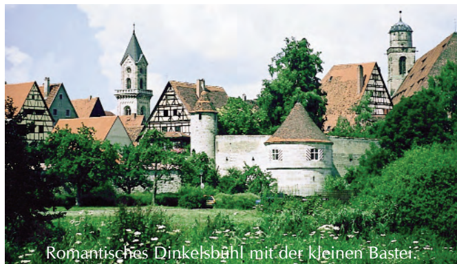
Romantisches Dinkelsbühl mit der kleinen Bastei.

Pfingstsonntag: Für alle Mittagsgäste erfolgt Rückzahlung des Eintrittsgeldes bis 15.00 Uhr!