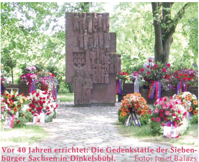
Vor 40 Jahren errichtet: Die Gedenkstätte der Siebenbürger Sachsen in Dinkelsbühl.

Sozialwerk der Siebenbürger Sachsen e.V. Karlstraße 100, 80335 München Konto-Nr. 907-133 300 Stadtsparkasse München, BLZ 701 500 00