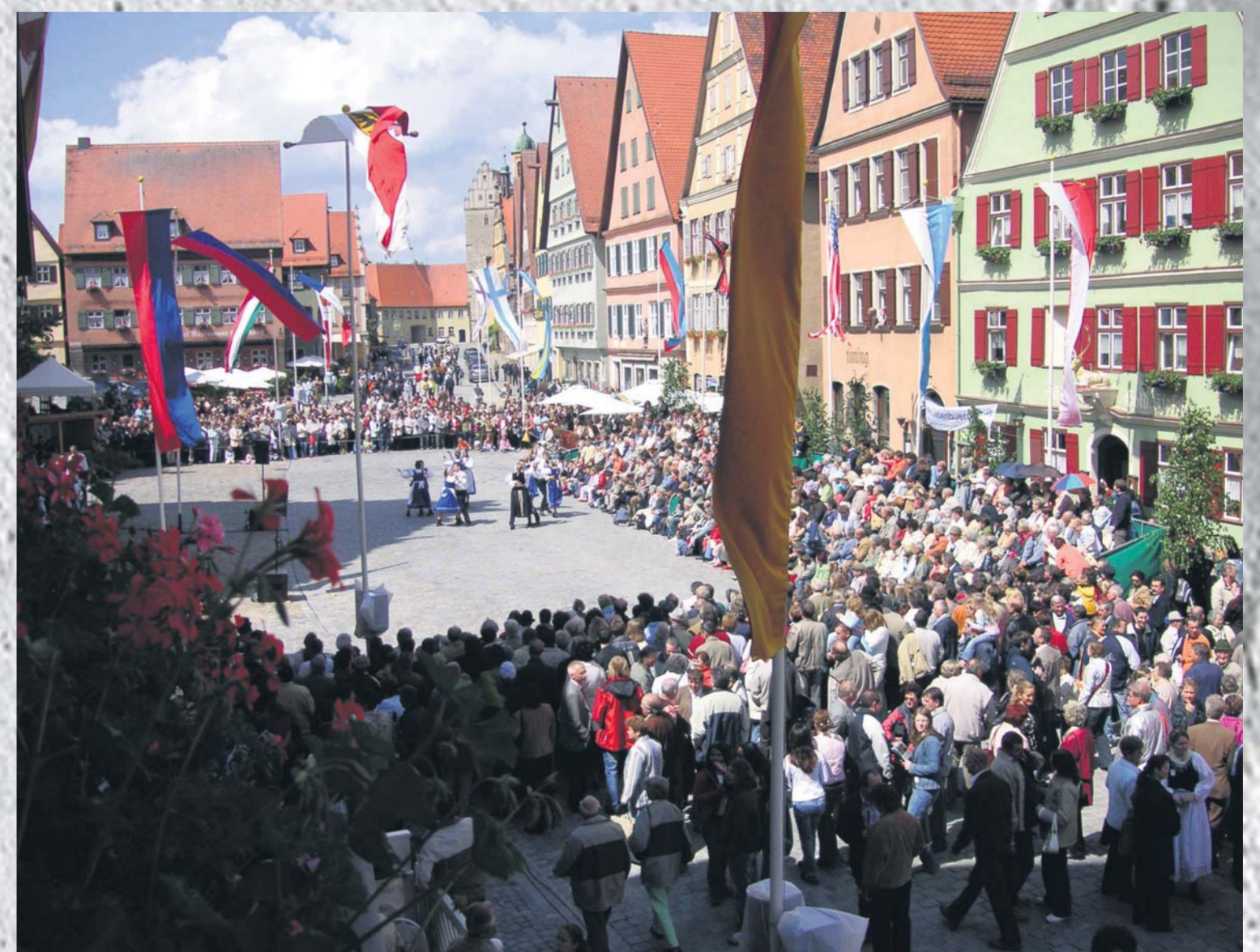
Abb. unten: Volkstanzenveranstaltung der Jugend vor der Schranne, 2006.