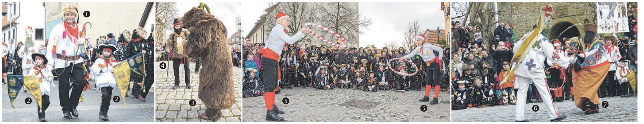
Die Brauchtumsfiguren: Der Umzug wird von der Schusterzunft angeführt. Ihr Repräsentant ist der Hauptmann 1 , der von zwei ähnlich gekleideten Kindern, den Engelchen 2 , begleitet wird. Die Kürschnerzunft wird von einem an der Kette geführten „Bären“ 3 und seinem Treiber 4 dargestellt. Begleitet von der Blasmusik tanzt der Bär zu den Trommelschlägen des Treibers. Dazu kommt noch die Kürschnerkrone, ein drehbares Rad, auf dem vier ausgestopfte Füchse mit je einem Marder im Maul stehen. Für die Fassbinderzunft steht der Reifenschwinger 5 . Im Takt der Musik schwingt er seinen Reifen, in dem ein, drei oder auch sechs Gläser Wein gestapelt sind. Die Symbolfiguren der Schneiderzunft sind das Schneiderrösschen 7 und sein Mummerl 6 . Mit einer kleinen Peitsche drängt das Rössel zu einem menuettähnlichen Tanz.