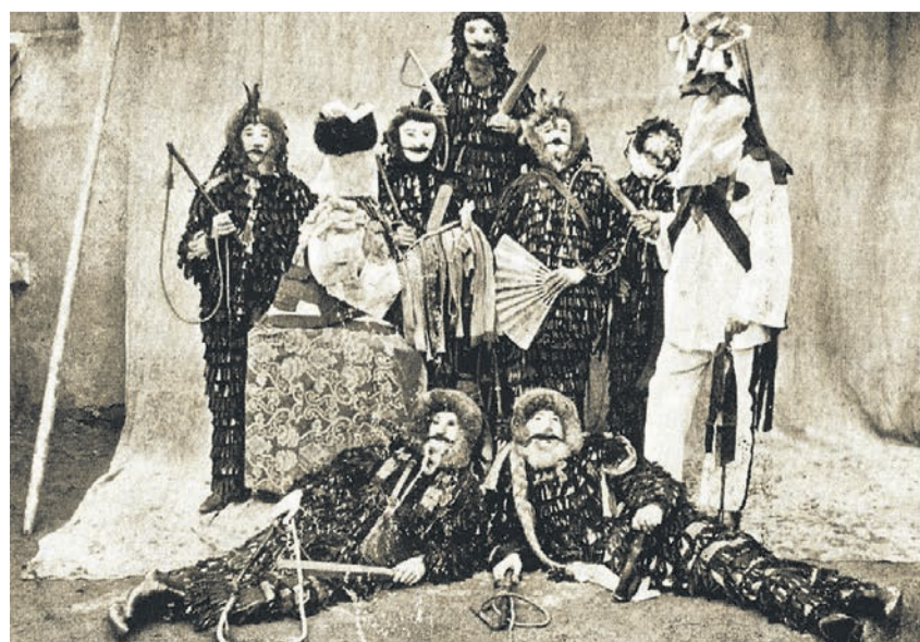
Historische Aufnahme vor 1895. Die originale Bildunterschrift lautet: „Urzeln beim Festzuge der Schneider-Zunft“.

Natürlich einen Urzelanzug: Hemd und Hose sind aus grobem, weißem Stoff, auf den unzählige dunkle, meist schwarze, gleichmäßig geschnittene