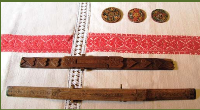
Tuchspanner (im Vordergrund: unten aus dem Jahre 1774 und darüber aus dem Jahr 1827) und Spinnwirtel aus Keisd. Die geschnitzten und bemalten Holzkreise steckte man zum Beschweren an die leere Spindel. Burschen schenken sie als Liebesbeweis an die Mädchen.

Weben forderte viel Konzentration und Genauigkeit und mehrere geschickte Hände, bis die Webkette zum Zopf abgekettet werden konnte. Dann musste dieser Zopf auf den Webstuhl eingefädelt und eingezogen werden, wozu wieder mehrere geschickte Hände benötigt wurden.