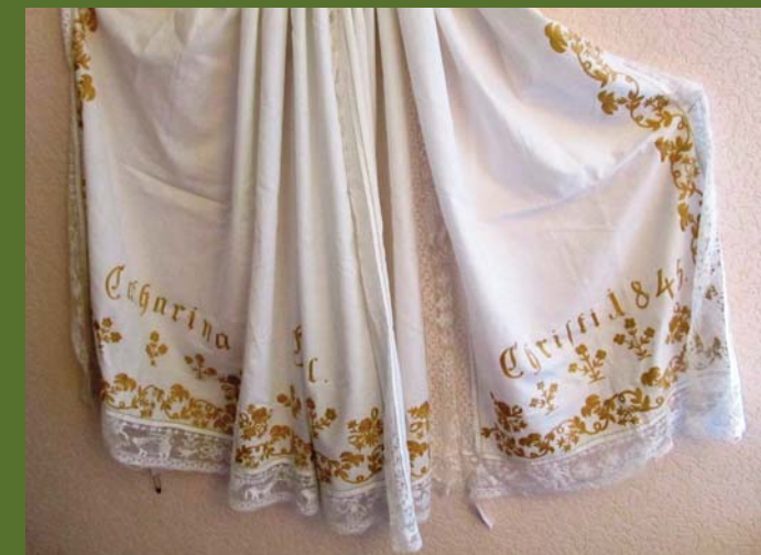
Goldbestickte Batist-Schürze aus dem Jahr 1845.