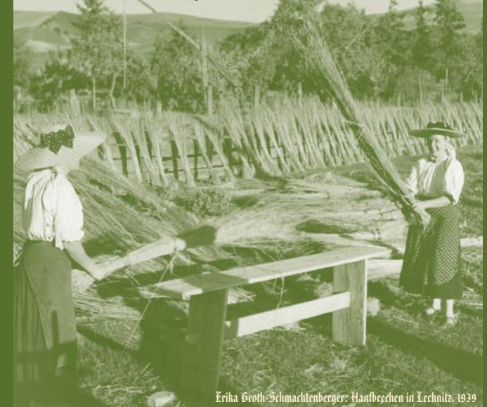
Hanfbrechen in Lechnitz, 1939