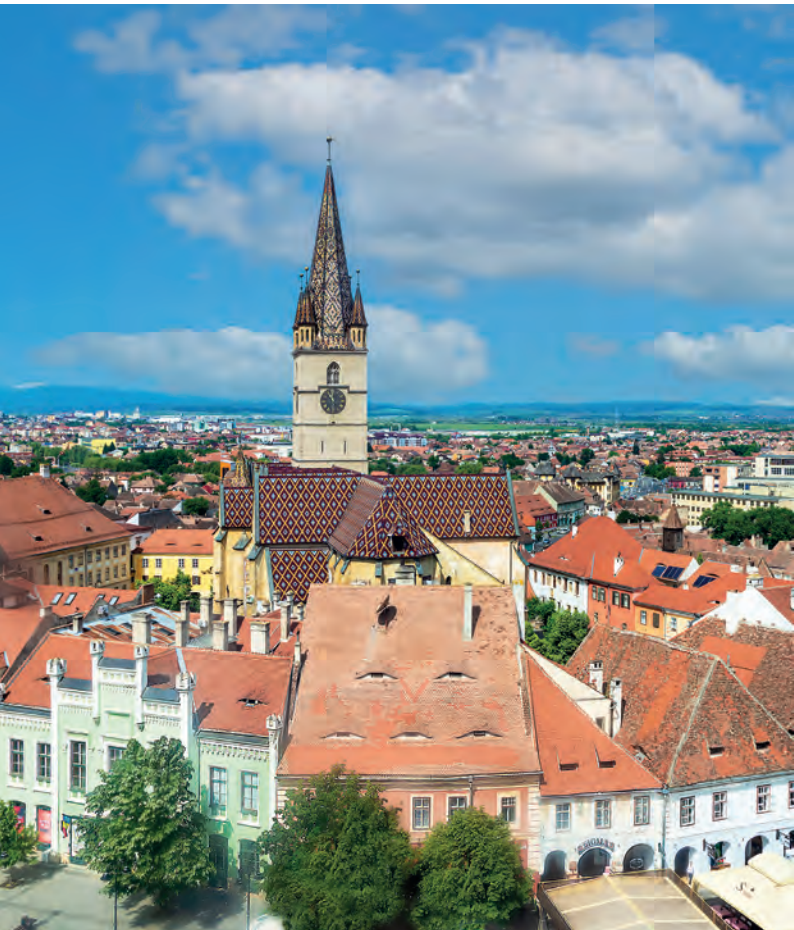
Hermannstadt, Europäische Kulturhauptstadt 2007, Sitz kirchlicher und politischer Vertretungen der Siebenbürger Sachsen.

Nur noch 10.000 Siebenbürger Sachsen leben in Siebenbürgen. Ihre politischen Interessen werden vom Demokratischen Forum der Deutschen in Rumänien vertreten, das sich auch um die Wahrung der kulturellen Identität bemüht. Den völkerrechtlichen Rahmen dafür bieten der im April 1992 zwischen Rumänien und der Bundesrepublik Deutschland geschlossene Freundschaftsvertrag, das Kulturabkommen von 1995 mit Bestimmungen zum Schutz der Minderheit und ihrer Kultur und die EU, der Rumänien seit 2007 angehört. Trotz ihrer geringen Zahl, ihrer Diasporasituation und ihrer Altersstruktur nimmt die siebenbürgisch-sächsische Minderheit eine völkerverbindende und friedenssichernde Brückenfunktion wahr, die auch von der Bundesregierung mit finanziellen Mitteln gefördert wird.