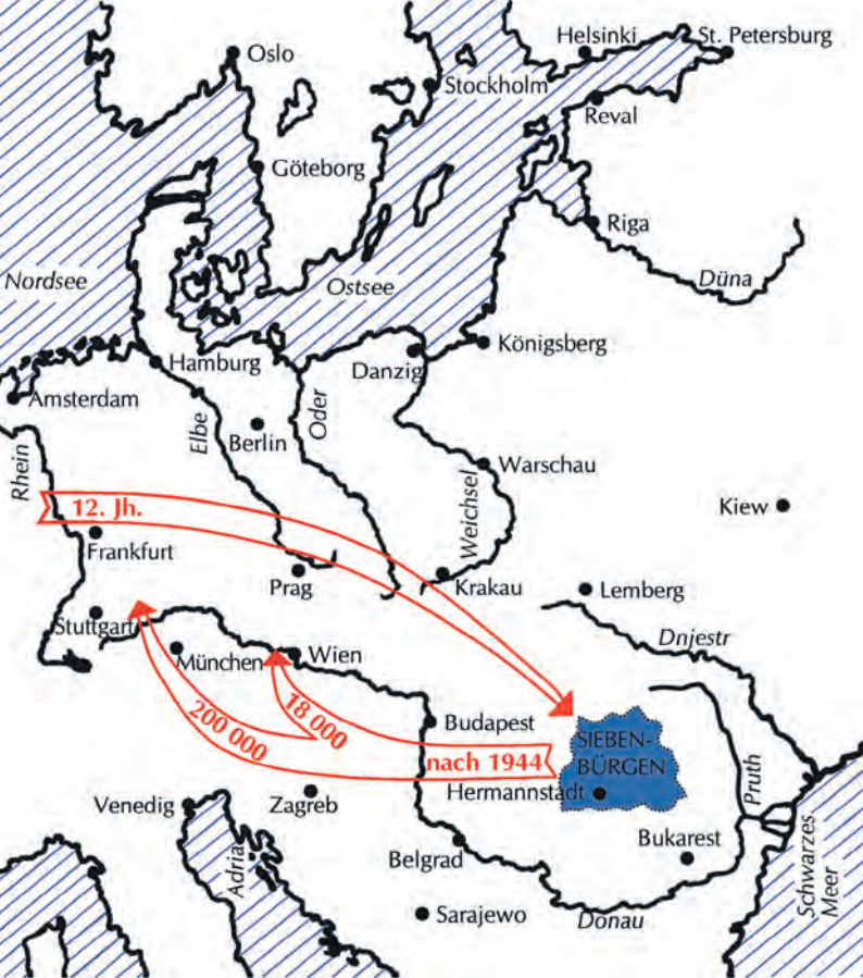
Karte: Hans-Werner Schuster

Im 12. Jahrhundert folgten Siedler aus dem Römisch-Deutschen Reich dem Ruf des ungarischen Königs nach Siebenbürgen. Durch die Anpassung an die Verhältnisse vor Ort und im steten Austausch mit dem Herkunftsraum konnten sie ihre kulturellen Werte bewahren und weiterentwickeln: wirtschaftliches und technisches Know-how, religiöse Überzeugungen und tradierte Sitten, deutsche Sprache und Kultur sowie ausgeprägte Freiheitsliebe und Toleranz. Ihr Siedlungsgebiet mit Territorialautonomie haben sie als Kulturlandschaft geprägt und ein Gemeinwesen aufgebaut, dessen Einrichtungen das Wohl des Einzelnen wie das der Gemeinschaft förderten. Als staatstragende Nation haben sie die Geschichte Siebenbürgens mitbestimmt und ihren Beitrag zur Entwicklung Ungarns sowie des Habsburgerreiches geleistet. Die Kriege und Wirren des 20. Jahrhunderts haben die Gemeinschaft der Siebenbürger Sachsen dezimiert und auseinandergerissen. Die Mehrzahl von ihnen lebt heute in Deutschland.