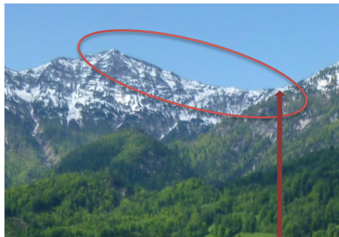
Blick zum Kalmberg, da fahren, gehen wir rauf

Am 31. Oktober 2017 jährt sich zum 500. Mal die Veröffentlichung der 95 Thesen, die Martin Luther, der Überlieferung nach, an die Tür der Schlosskirche zu Wittenberg schlug.